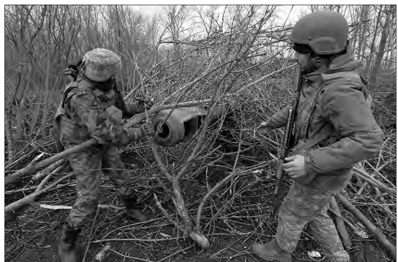
Артилеристи маскують гармату.