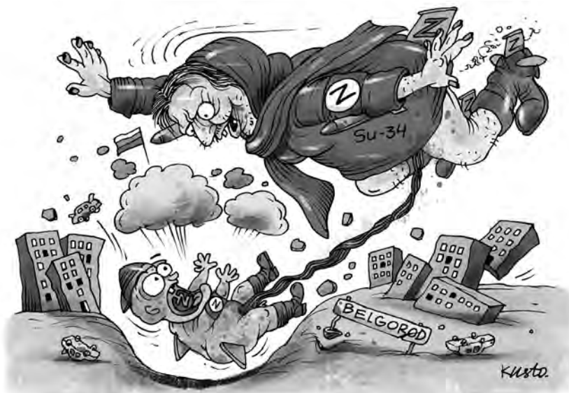
Белгород: нештатні авіапологи.