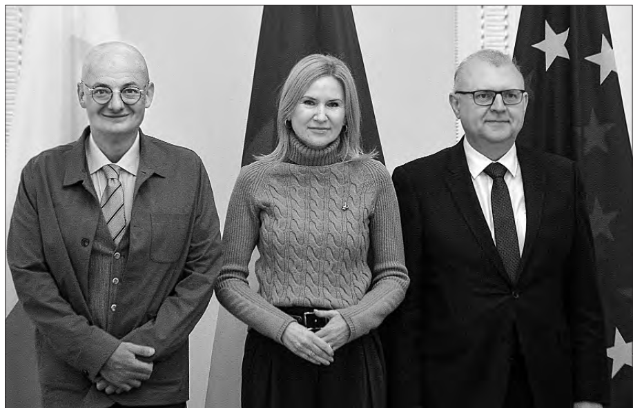
Заступниця Голови Верховної Ради України Олена Кондратюк зустрілася із парламентаріями Сенату Республіки Польща — Віцемаршалком Міхалом Камінським (на знімку ліворуч) та сенатором Казімежем Міхалом Уяздовським (на знімку праворуч).

Це вже друга зустріч із паном Віцемаршалком за останній час. Попередня відбулася у Варшаві напередодні голосування в польському Сенаті за резолюцію щодо засудження масового викрадення росією українських дітей.