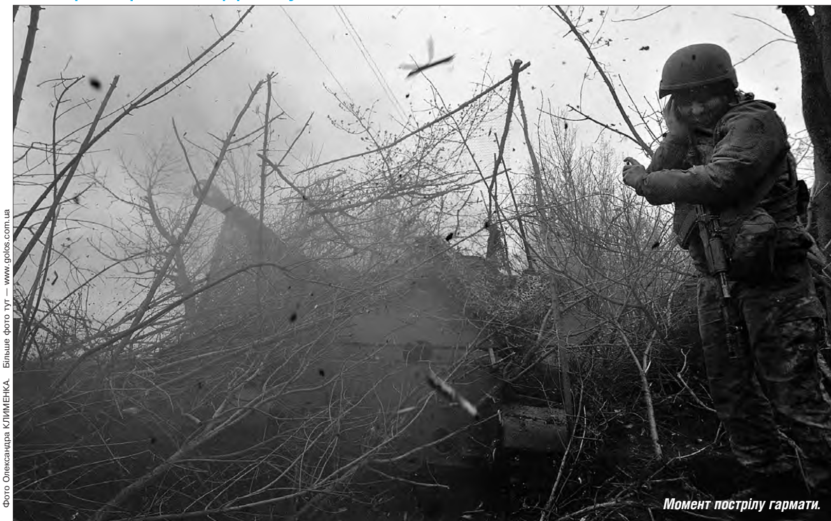
Фото Олександра КЛИМЕНКА. Більше фото тут — www.golos.com.ua

Після переговорів з Президентом України Володимиром Зеленським Єнс Столтенберг зазначив, що союзники оголошать про нову конкретну допомогу для України на додачу до вже наданої, та нагадав, що Нідерланди і Данія вже оголосили про передачу 14 танків Leopard, а США — про черговий пакет допомоги зі снарядами для артилерії і HIMARS. ▶ СТОР. 5