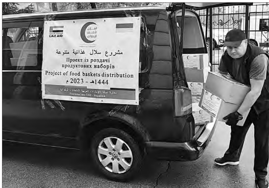
Розвантаження допомоги від Посольства ОАЕ та організації Червоного Півмісяця Еміратів.