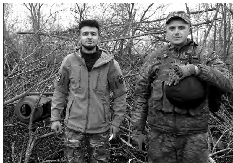
«Шайтан» і «Скіф».